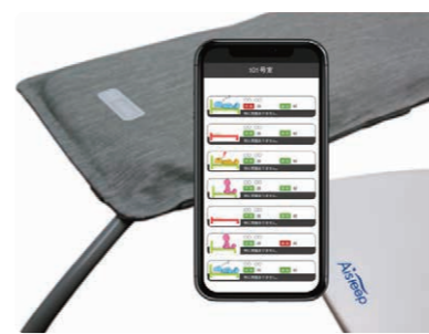
見守り睡眠センサー (AiSleep:TAOS研究所)

介護ロボットにも種類がありますが、今注目されているのが睡眠見守りセンサーです。主にベッドマットの下に敷くことで起き上がりや離床などベッド上の状態、心拍・呼吸などのバイタル計測、睡眠状態の解析を行うなどの機能があります。