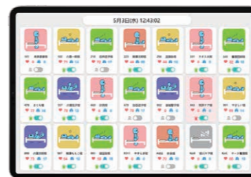
見守り睡眠センサー (AiSleep:TAOS研究所) 離れた場所からリアルタイムで離床、呼吸、脈拍などが確認できる

睡眠見守りセンサーでの導入キーワードは、「トイレ・排泄、転倒リスク・離床検知、夜間ケア、生活リズム(睡眠状況、離床回数)などです。導入後の職員のアンケートによると46.2%が「非常に役立つ」、49.8%が「少し役立つ」と回答して、96%の職員が肯定的でした。