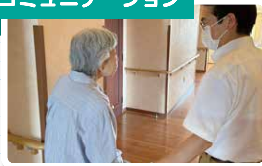
不安や緊張を和らげ、安心して生活してもらうために日頃のコミュニケーションが大切になります。