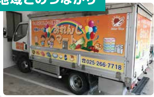
地域住民に介護施設があることを知ってもらい、災害時などの連携体制をとる上でも日頃からの地域交流は大切です。