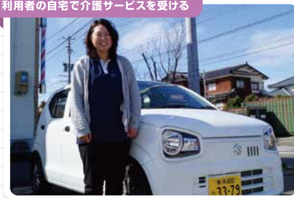
●訪問介護・訪問入浴など