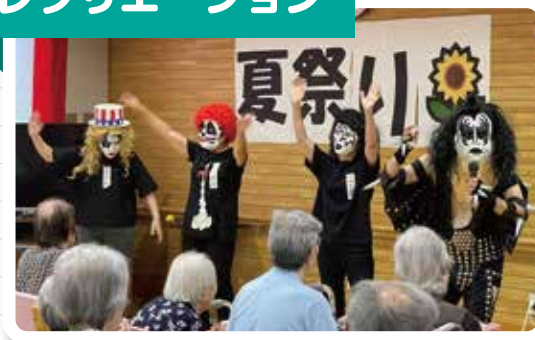
生活の質を高められるように、個々の高齢者のニーズに合わせて個別または集団でレクリエーションを行います。