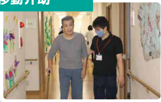
自分自身での移動が困難な方の移動介助を行います。