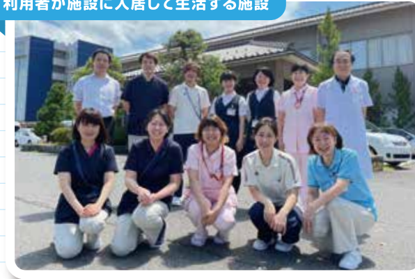
●介護老人福祉施設・介護老人保健施設など