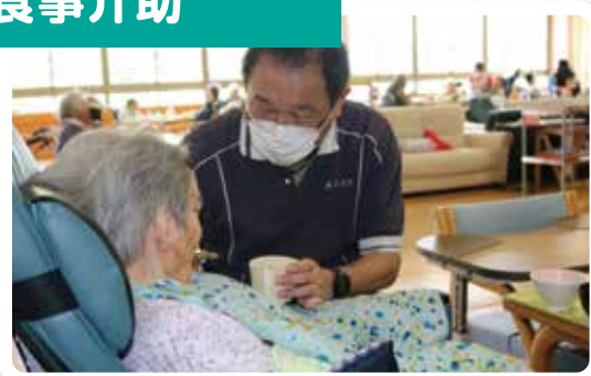
一人で食事ができない方のために必要な介助を行います。食事環境を整えることも大事です。