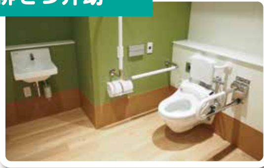
一人で排泄が難しくなった方や、排泄機能に障害がある方のおむつ交換、トイレでの介助を行います。