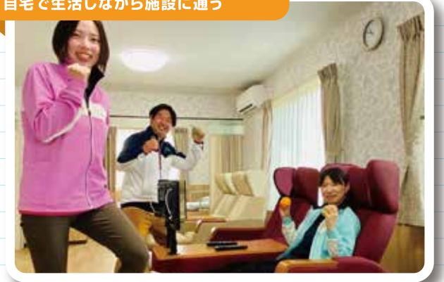
●デイサービス・デイケアなど